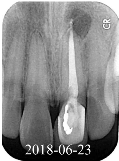
圖 B 由於患者堅持不願拆冠，主責醫師也不希望因臨時套冠而引發接續隱適美治療的種種不便，只得妥協直接自舊套冠打洞，完成根管再治療